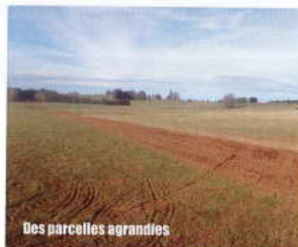
Des parcelles agrandies

... et maintenant la commune va porter les travaux connexes (parcelles, voirie) pour environ 1 200 000 € HT et a organisé en parallèle un appel à candidature pour la vente des communaux à vocation agricole dont les ex sectionnaux.