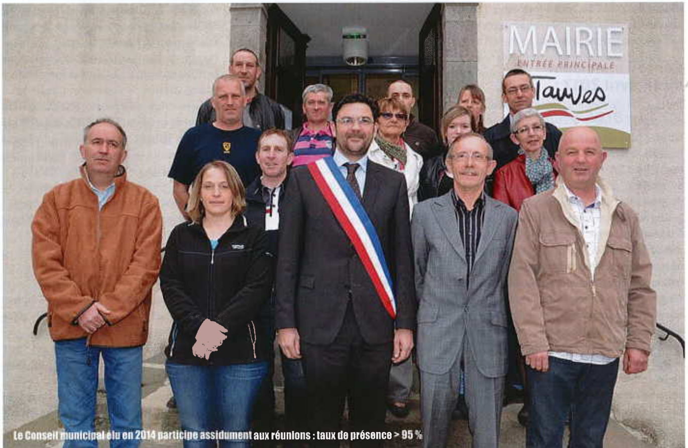
Le Conseil municipal élu en 2014 participe assidument aux réunions : taux de présence > 95 %

Régime indemnitaire du personnel – projet d'aménagement d'un local pour club photo – travaux d'éclairage public tranche 1 (rue du 19 mars) – travaux d'enfouissement des réseaux télécoms tranche 1 (rue du 19 mars) – information recensement général de la population – révision triennale du loyer gendarmerie – ajustements des plans de modification de la voirie suite à enquête publique – informations médiathèque – motion de soutien au pastoralisme