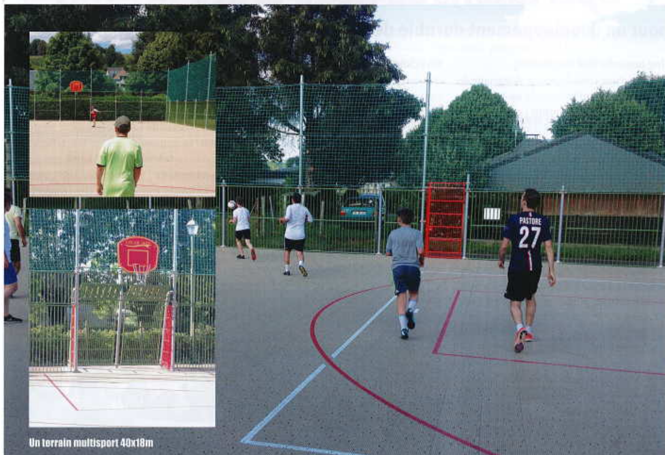
Un terrain multisport 40x18m