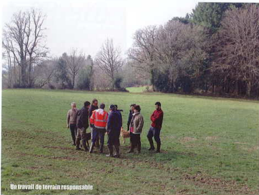
Un travail de terrain responsable