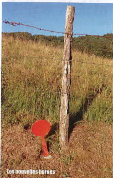
Les nouvelles bornes