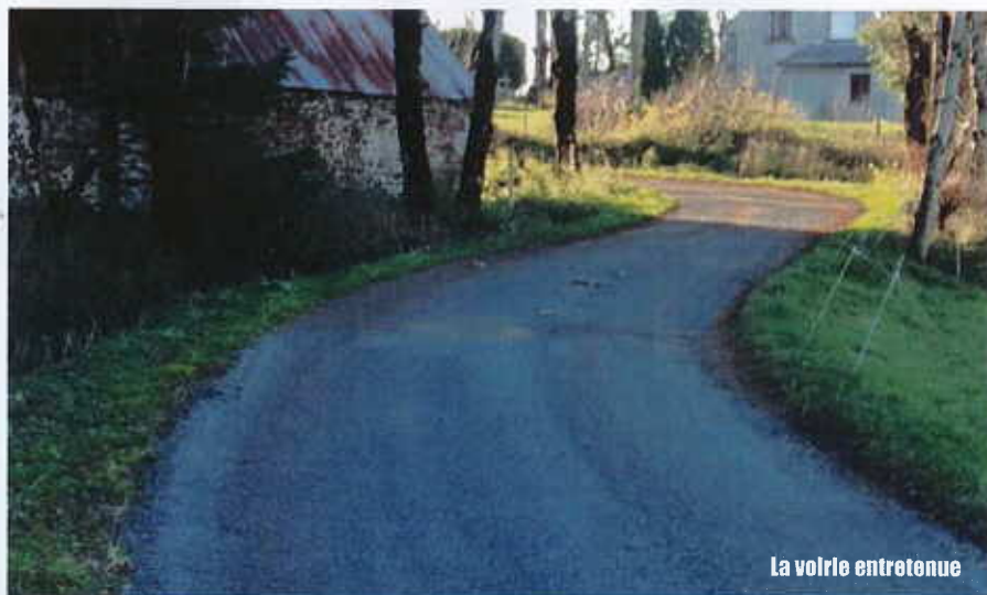
La voirie entretenue

16 240 € en 2017 sur les huttes, la piscine, les blocs sanitaires