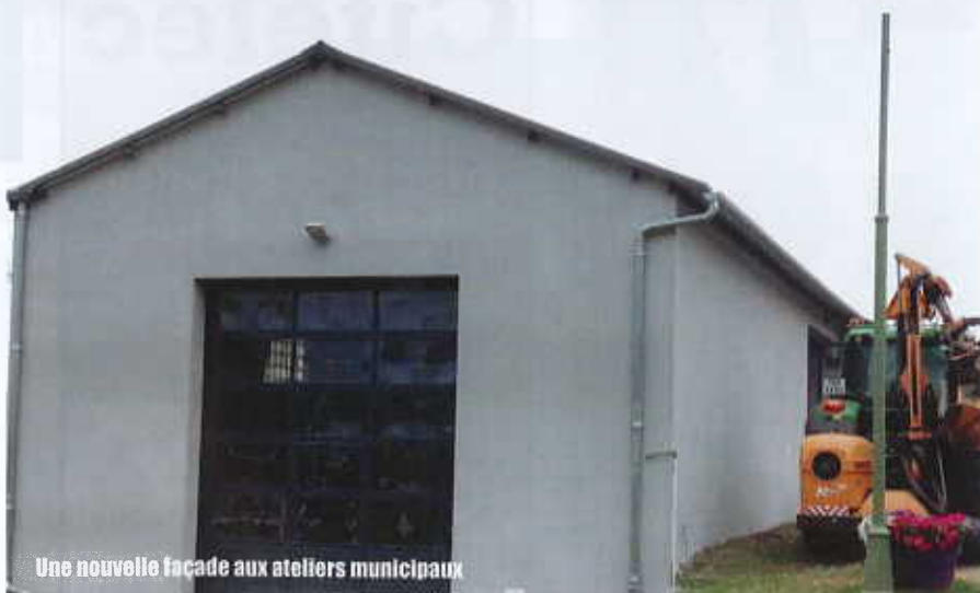
Une nouvelle facade aux ateliers municipaux