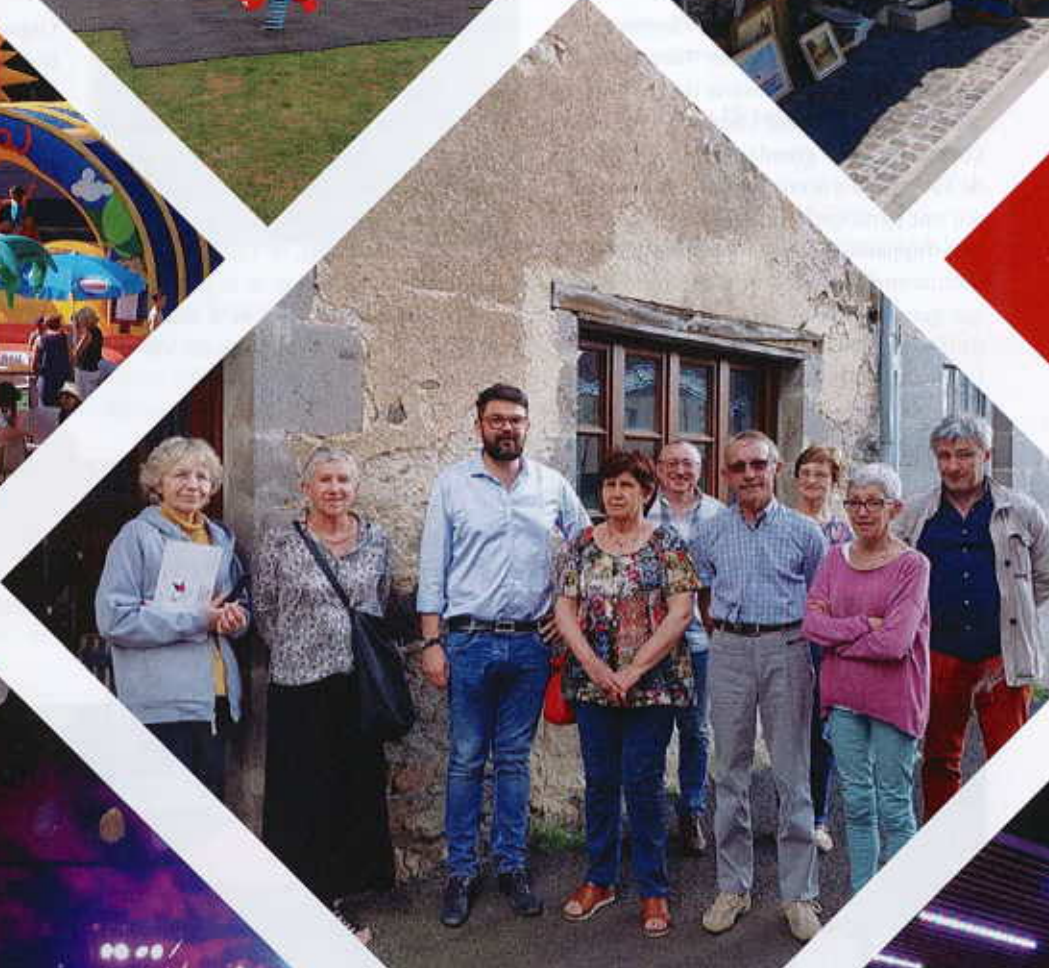
Le secours populaire 63 ouvre une antenne à Tauves