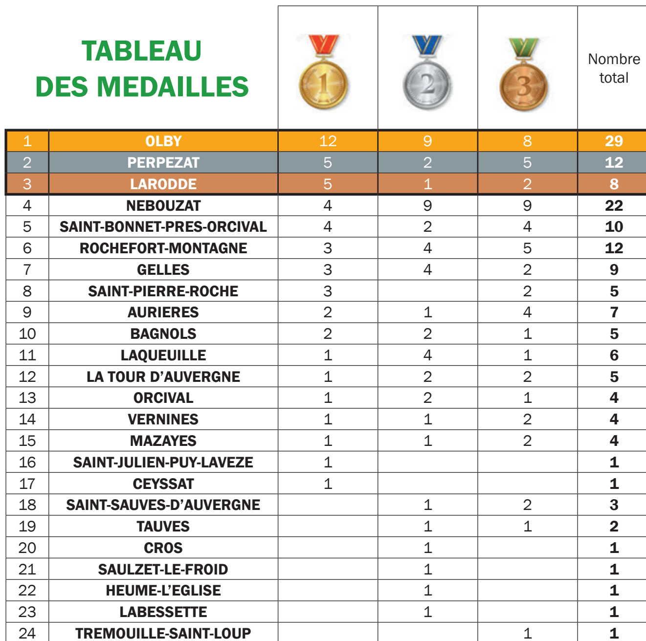
TABLEAU DES MEDAILLES

Des médailles et trophées 100% locaux ont été distribués aux vainqueurs, réalisés par des artisans locaux : en chocolat, en bois, en lave émaillée et en métal.